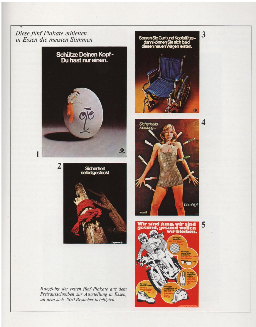
Abbildung 2: Unfallverhütungspakete aus dem Jahr 1975