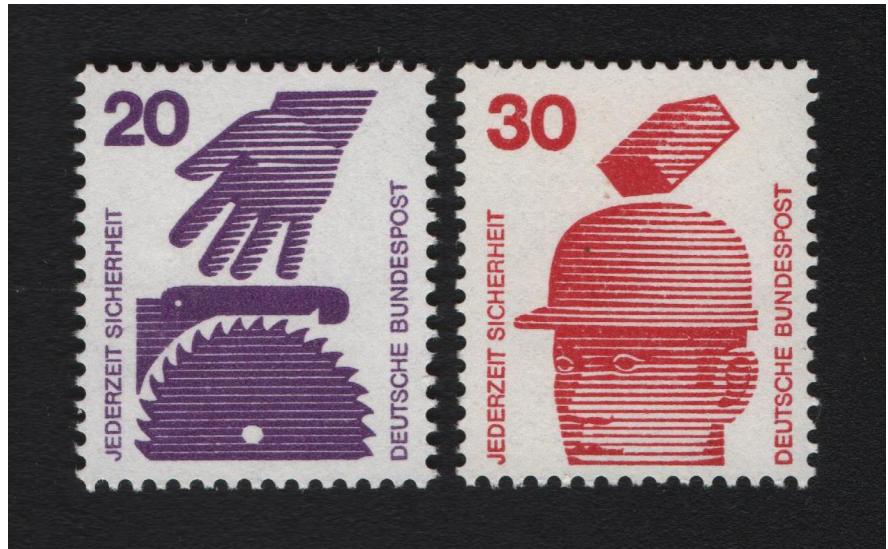
Abbildung 3: Der Arbeitsschutz wurde Gegenstand einer Briefmarken-Serie, die von 1971 bis 1973 erschien.

der Beschäftigten und der Arbeitgebenden prädestiniert. Zuletzt sollte auch die demokratische Legitimierung durch die Sozialwahlen ein stetiges Reformfeld für eine lebendige Demokratie sein. ➔