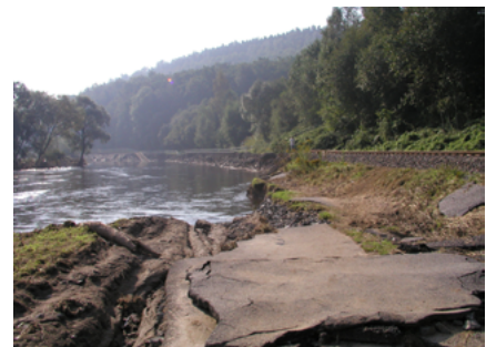
Abbildung 8: Zerstörte Straße und Eisenbahnstrecke bei Flöha

Grafik: Daten des Bayerischen Landesamts für Wasserwirtschaft