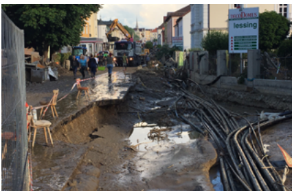
Abbildungen 1–5: Katastrophale Schäden in Niederbayern, hier im Stadtgebiet von Simbach am Inn und im südlichen Teil des Landkreises Rottal-Inn, ausgelöst durch ein eher punktuell Starkregenerereignis mit Zerstörung von vielen Gebäuden und der Infrastruktur, etlichen Toten, zahlreichen Verletzten binnen weniger Stunden