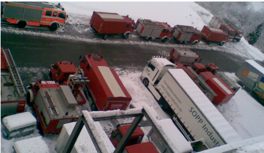
Abbildung 9: Einsatz der Feuerwehr Düsseldorf in überörtlicher Hilfe nach starken Schneefällen zum Abräumen einsturzgefährdeter Dächer im Bergischen Land