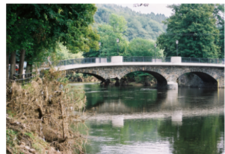
Abbildung 7: Fehlender Brückenpfeiler nach Überflutungen bei Flöha

Zu den „üblichen“ Einsatzfolgen wie Überflutungen, vollgelaufene Keller, Arbeiten und Einsturzgefahren hinzu, zum Beispiel beim Schneeräumen von Dächern. Weitere Gefahren können im Umgang mit Kettensägen entstehen oder durch Folgeeinsätze: elektrische Kurzschlüsse mit Stromausfall und Folgebränden, ABC-Einsätze durch aufgeschwemmte Öltanks oder umgekippte, undichte oder aufgelöste Gefahrgutbehälter.