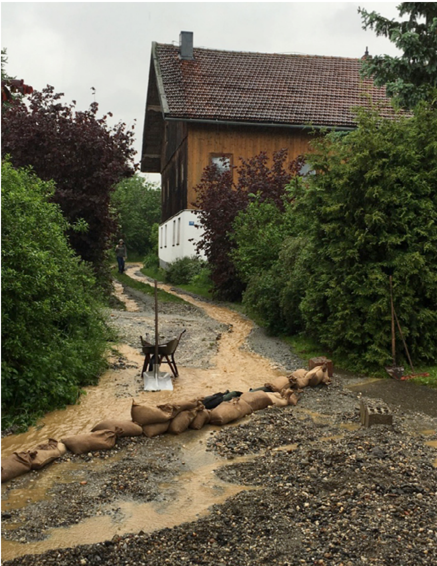
Abbildung 10: Sandsäcke falsch verlegt – nicht jede gut gemeinte Hilfe ist auch gut gemacht ...